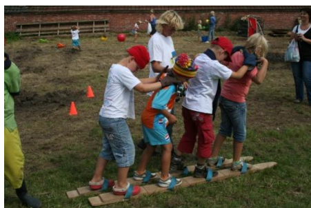
Allerlei leuke spelletjes

De eerste Kinderspeelweek in Hellum was een groot succes. Bijna alle kinderen in de basisschoolleeftijd deden mee. Hieronder een impressie.