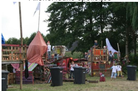
En prachtige timmerwerken